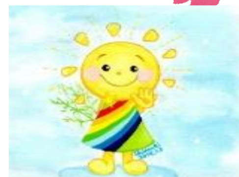
4グループ とよだ ただし 豊田 正 支援員

今年度から花畑あかしあ園から神明福祉園の 4 グループに異動してきました北川達也と申します。ご利用の方が安心した園生活を送れるよう、皆様と一つひとつ確認をさせていただきながら、様々な活動の場面においても楽しさを感じていただける支援ができるよう努めてまいります。また 4 グループ以外のご利用者の方ともウォーキングや様々な活動で、一緒できることを楽しみにしております。どうぞよろしくお願いいたします。