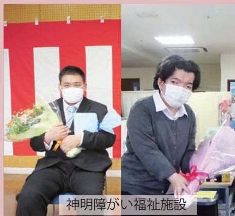
神明障がい福祉施設