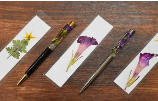
手元が華やぎ、心地よい気持ちにさせてくれます。

専用オイルで植物を保管する「ハーバリウム」の技法を用いて、手元に花を咲かせるボールペンが完成しました。Cグループにて制作し、ふぉらんにて販売していますので、是非手にとってみてください。