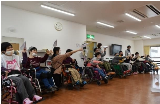
一斉に飛び立つ紙飛行機はまさに圧巻。

Bグループでは、紙飛行機作りを行いました。集中して折り紙を折る動作、そして、折った飛行機を投げる動作と、頭と身体を存分に活用した活動となりました。