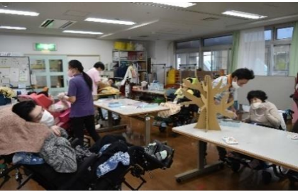
華やかな「りんごの木」の完成です。