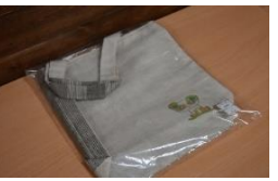
様々なデザイン、カラー、サイズ。きっとお気に入りの一つに出会えるはず。