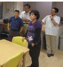
綾瀬ハウスメンバー