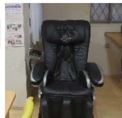
生活されている方が 利用されている疲れを癒 してくれるマッサージ器