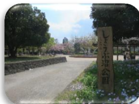
散歩(しょうぶ沼公園)