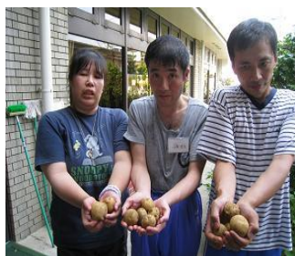
みんなで協力して育てました！