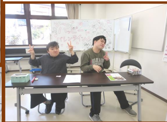
↑ 受付担当のお二人です！