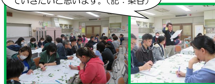
＜サービス向上研修＞