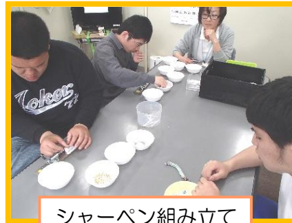
シャーペン組み立て