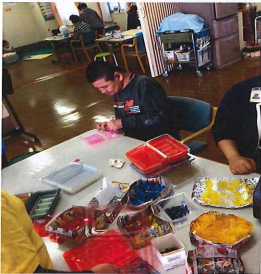
キラキラした物がたくさんできます。