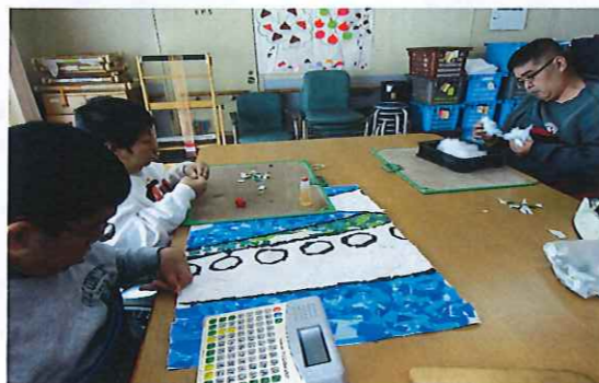
きっと空も飛べるはず・・・