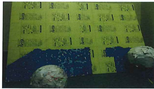
世界文化遺産バンザイ！！