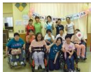
↑準優勝4F女子チーム