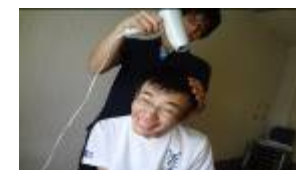
←風呂上がりの整容^^