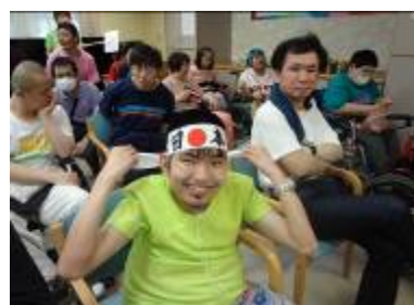
↑結果発表「やったぞ！！優勝」