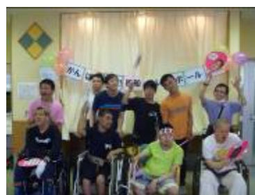
↑優勝した4F男子チーム